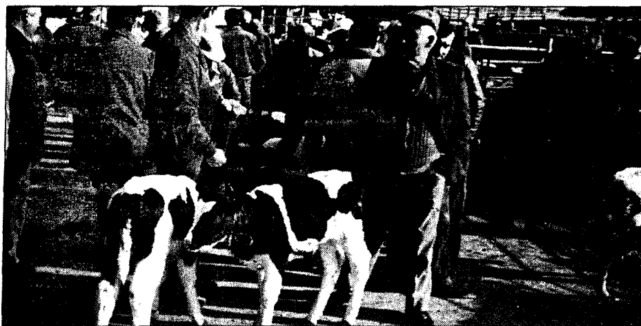
Mercado de Talavera del día 15 de febrero pasado.

— dentro de cada extracto, la gestión adecuada de la explotación permite mejorar considerablemente el "margen" total. El caso más espectacular es el de las explotaciones con 10 o 15 vacas, en el que la diferencia entre la explotación media y la explotación de cabeza alcanza el 128%. Prácticamente esta última explotación genera un "margen" similar al "margen" medio de las explotaciones del estrato superior.