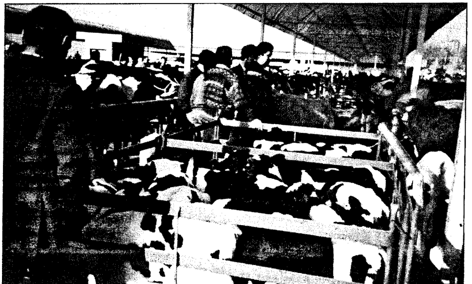
Mercado quincenal de Talavera.

—un sector lechero saneado en España al horizonte 2.000 debería contar con 50.000 a 60.000 explotaciones, recayendo el peso fundamental de la producción en explotaciones de tamaño mediano o grande.